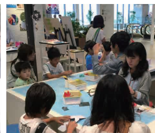
▲ インターン事例：ワークショップ開発