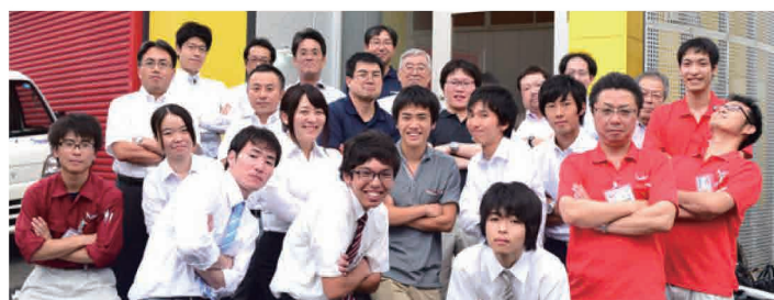
▲ 墨田区工場 三社合同インターンシップ報告会の様子